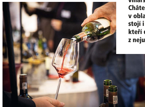
Za bohatou historií vinařského komplexu Château Palmer v oblasti Bordeaux stojí i příběhy lidí, kteří dělají jedno z nejuznávanějších vín.

whisky či vzácná vína, přidanou hodnotou je, že jde o reálná aktiva. Mají sice i své nevýhody, například nenesou průběžný výnos, je u nich horší zpeněžitelnost, je třeba investovat vyšší částky, ale je v nich emoce. Pokud tedy investujete do něčeho, co máte rádi. Pak pro vás mají nejen hodnotu, ale obohacují vás svými příběhy, jsou kolem nich konkrétní lidé, skutečné osudy, jsou hmatatelné, laicky řečeno, můžete se s nimi „pomazlit“. A z odborného hlediska jde o dobrý investiční nástroj, jak dál diverzifikovat stávající a funkční portfolio tradičních aktiv. Výhodou jsou zpravidla jak větší výnosy, tak jistá stabilita v čase neboli odolnost vůči recesi a inflaci.